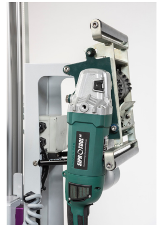
DF-130 Wandfräsmaschine Art.-Nr. 401.1002