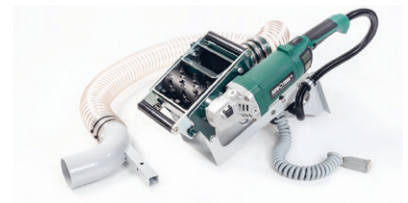
DF-130 Deckenfräsmaschine PRO