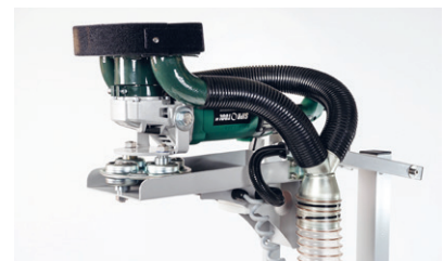
DF-130 Deckenschleifsystem Pinky